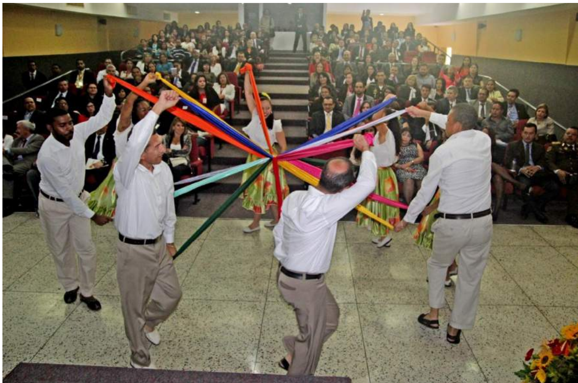
Presentación cultural durante el acto de clausura del Programa de Pasantías.