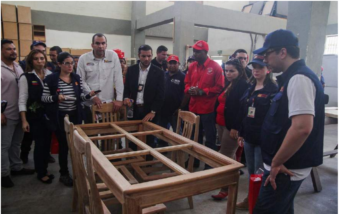
Recorrido por las instalaciones del Internado Judicial Región Capital Rodeo III.