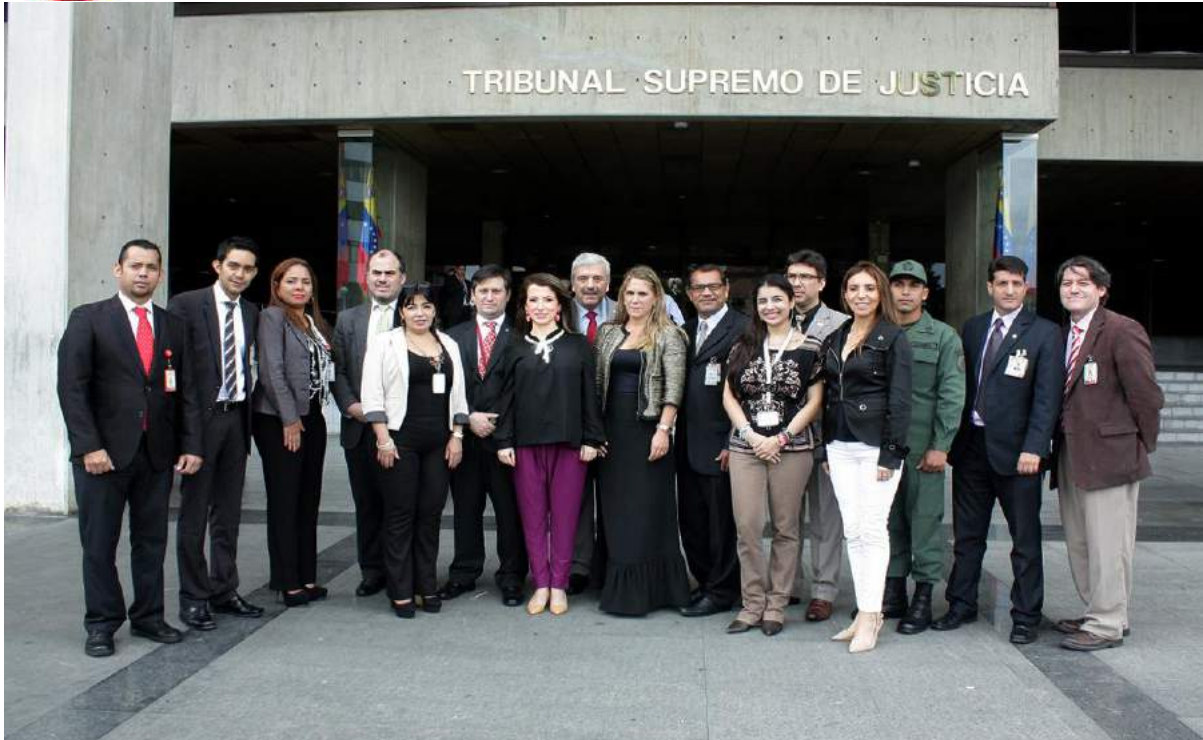
Visita al Tribunal Supremo de Justicia. (Máximo tribunal de la República Bolivariana de Venezuela)