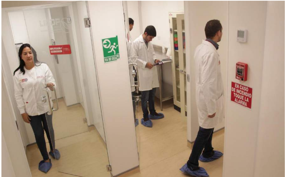
Recorrido por el Laboratorio de Identificación Genética de la Defensa Pública.