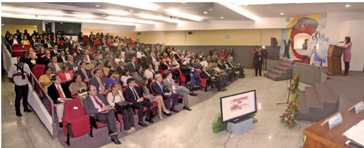
Acto de instalación del Programa de Pasantías del BLODEPM en Venezuela.