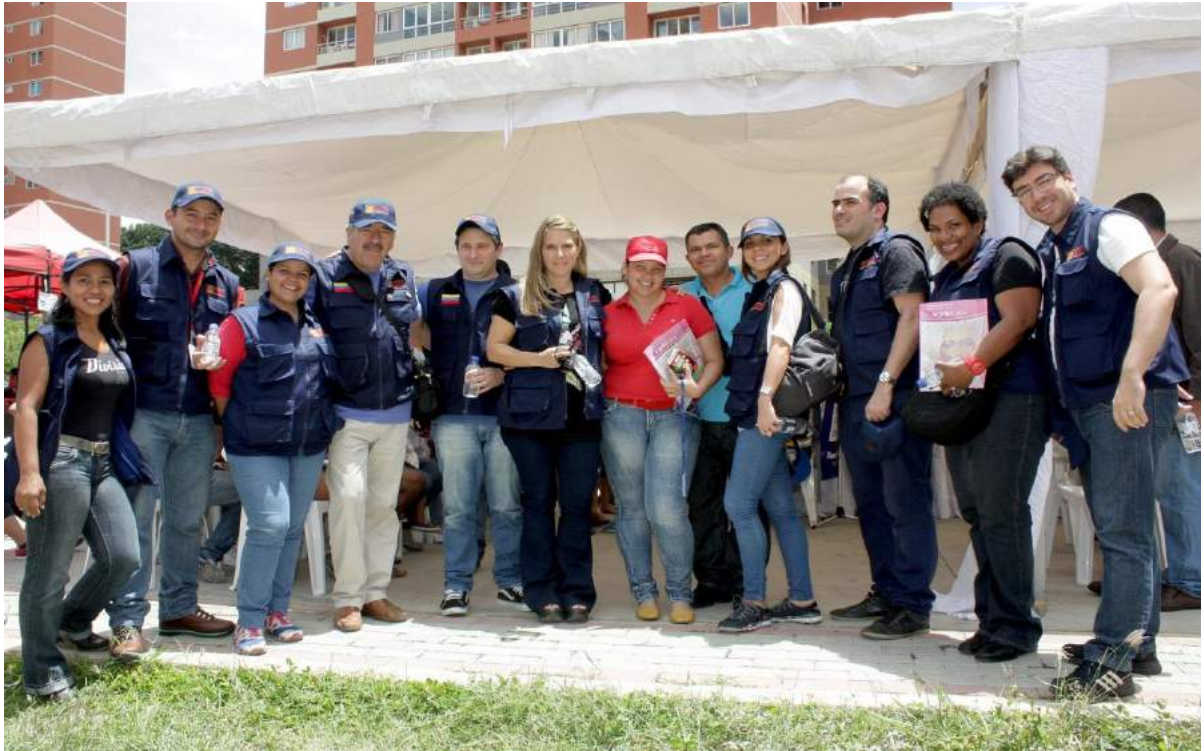
Participación de los pasantes en las Jornadas de Calle que realiza la Defensa Pública.