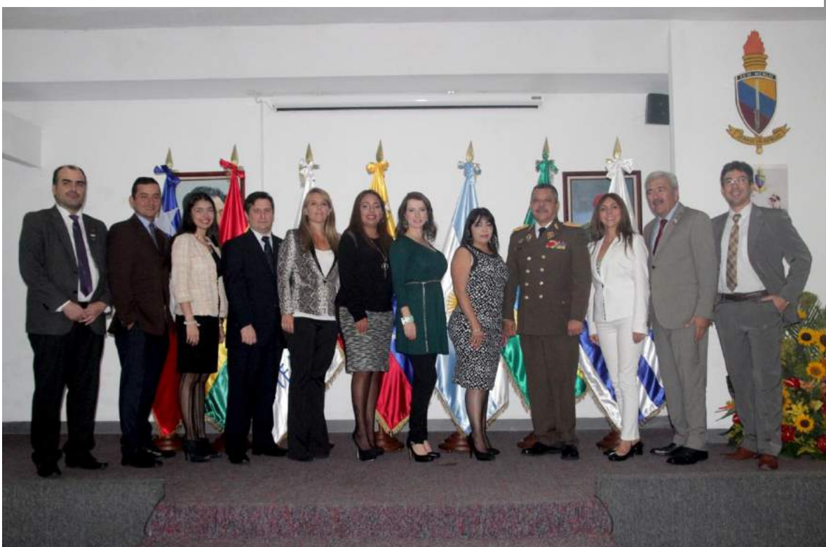
Foto oficial de la clausura del Programa de Pasantías del BLODEPM en Venezuela.