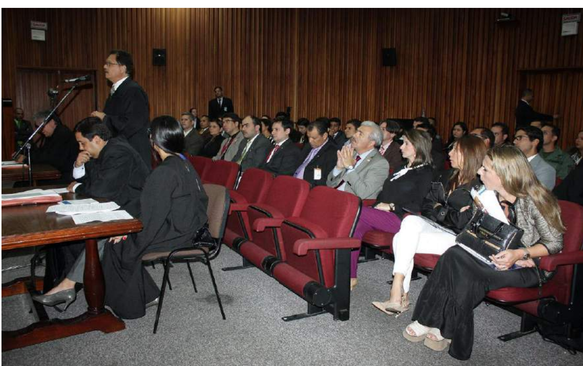
Pasantes presenciando una audiencia oral y pública de la Sala de Casación Social del Tribunal Supremo de Justicia.