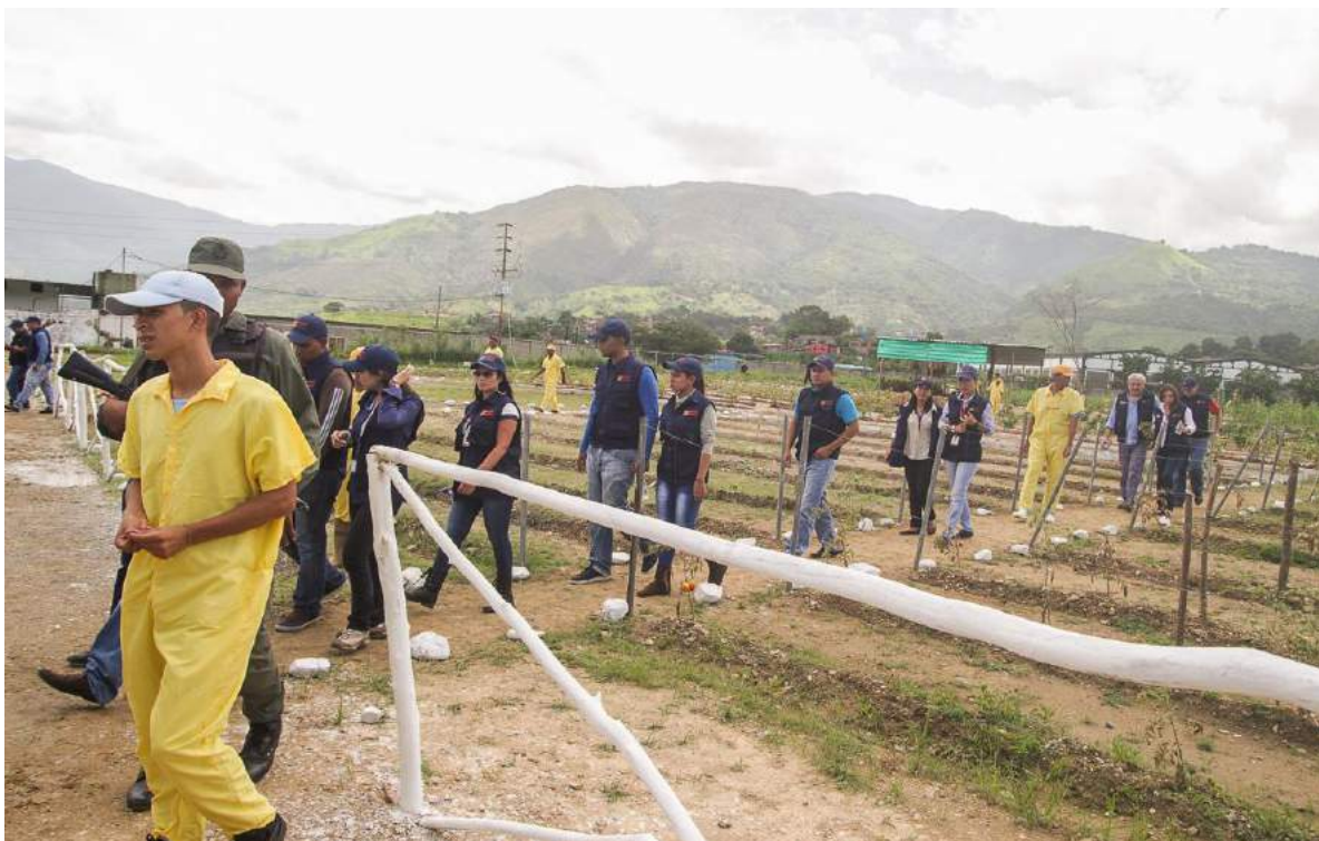
Siembra por parte de los privados de libertad dentro del Internado Judicial Región Capital Rodeo III.