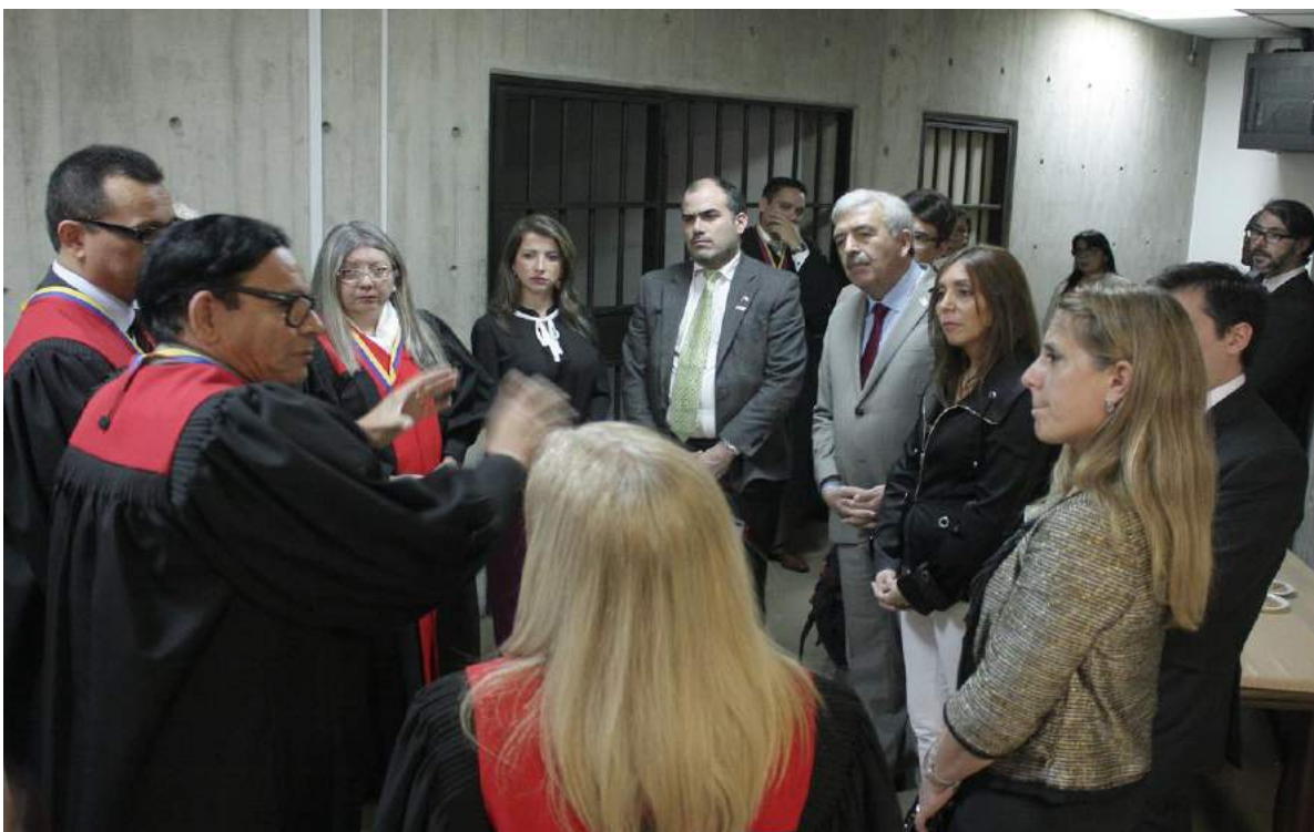
Recorrido por las instalaciones e intercambio con Magistrados del Tribunal Supremo de Justicia