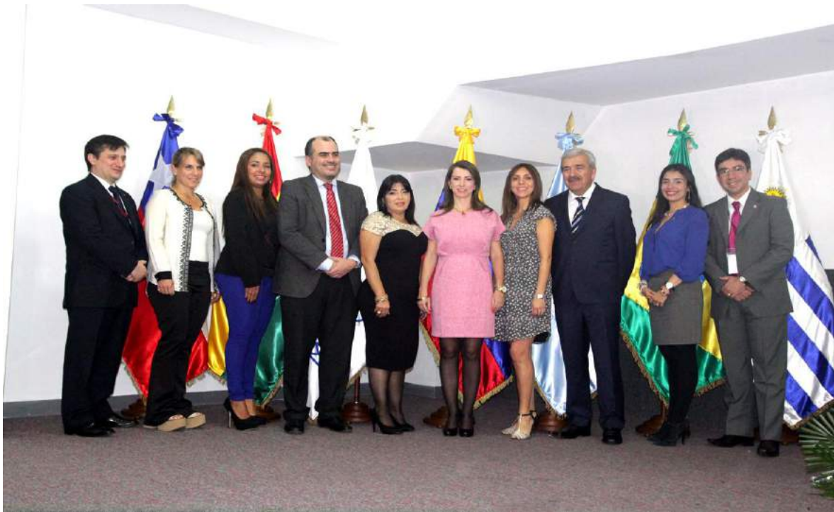
Acto de Apertura del Programa de Pasantías del BLODEPM en Venezuela.