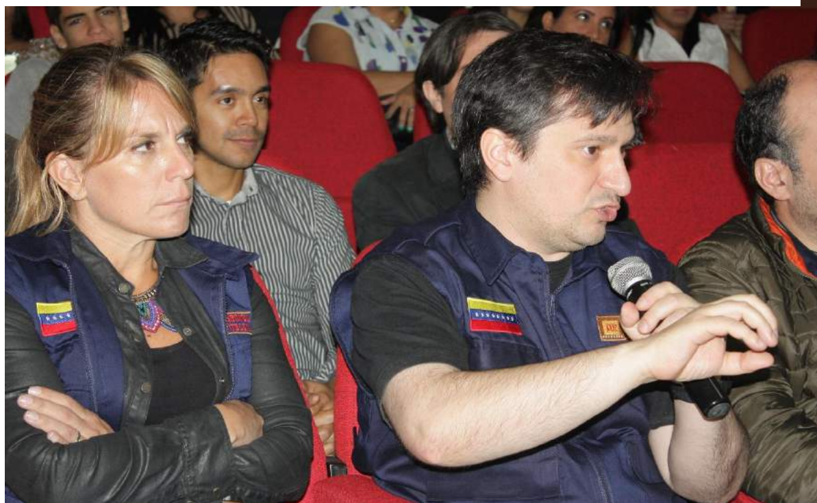
Ciclo de preguntas y respuestas durante las ponencias.