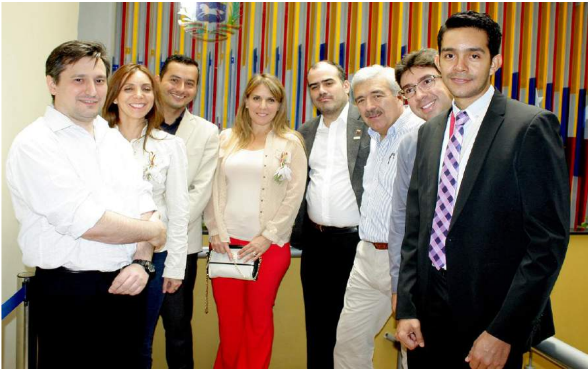
Pasantes compartiendo con los Defensores Públicos venezolanos.