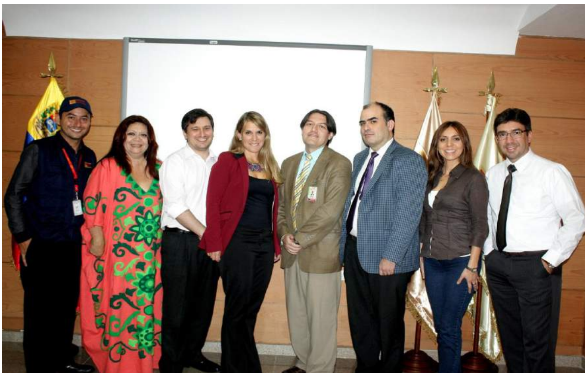
Defensora Pública Indígena compartiendo con los ponentes.