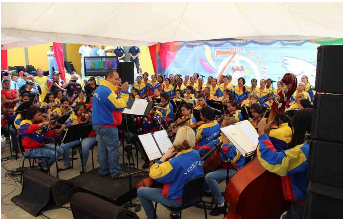
Orquesta sinfónica penitenciaria conformada por privados de libertad.