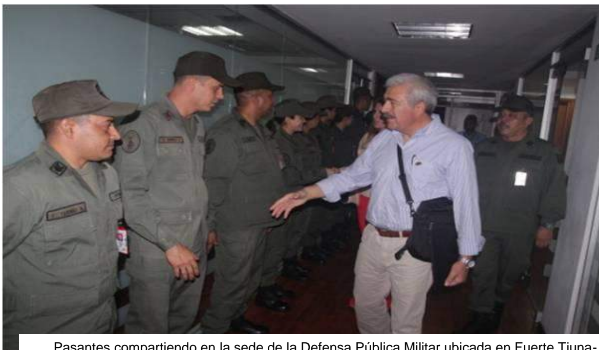
Pasantes compartiendo en la sede de la Defensa Pública Militar ubicada en Fuerte Tiuna-Caracas