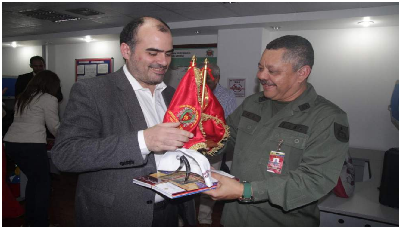
Visita a la sede de la Defensa Pública Militar.