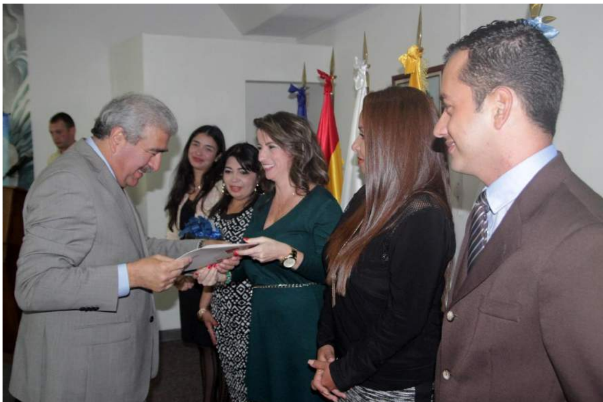
Entrega de certificado de participación a los pasantes del Programa de Pasantías del BLODEPM