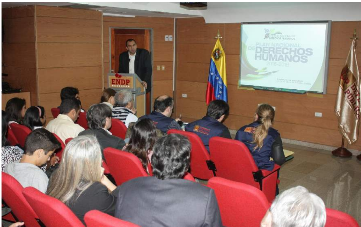
Ponencia sobre el Plan Nacional de Derechos Humanos, a cargo del Dr. Larry Devoe, Secretario Ejecutivo del Consejo Nacional de Derechos Humanos.