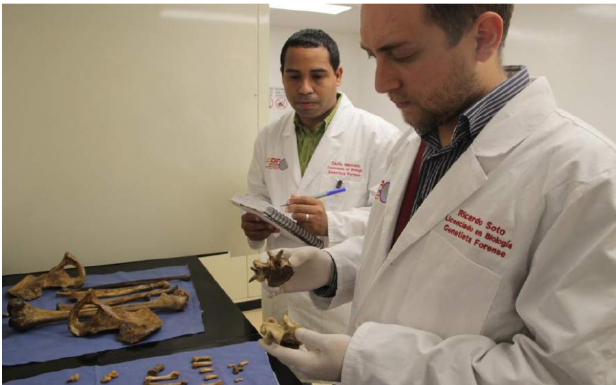
Recorrido por el Laboratorio de Identificación Genética de la Defensa Pública.