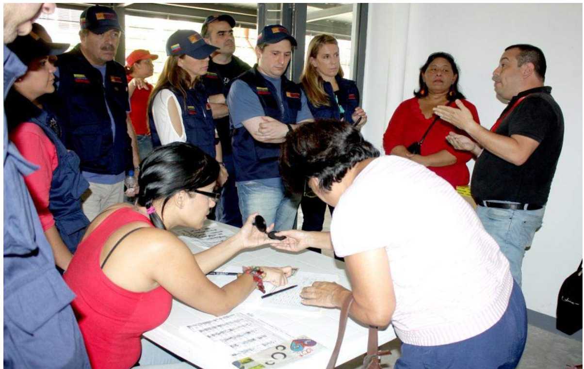
Asesorías jurídicas gratuitas y personalizadas que brinda la Defensa Pública.