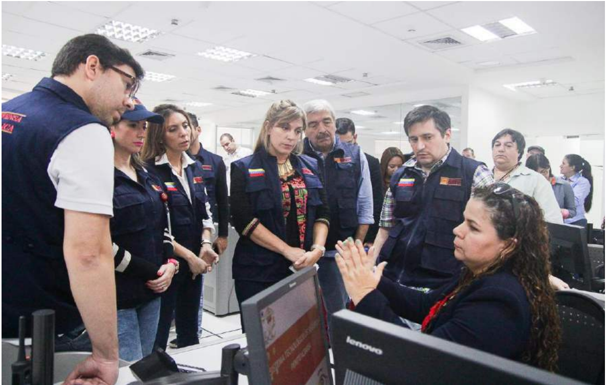
Pasantes compartiendo con la Ministra del Poder Popular para el Servicio Penitenciario, Dra. Iris Varela.